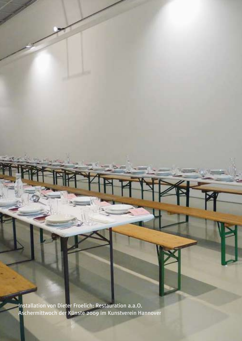
Installation von Dieter Froelich: Restauration a.a.O. Aschermittwoch der Künste 2009 im Kunstverein Hannover